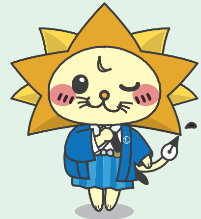
日司連公式キャラクター「しほ〜しし」